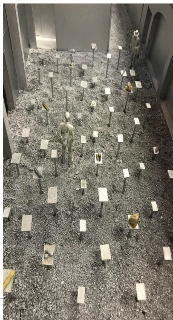
Esposizione di materiali e risorse utilizzate per formare le maniglie