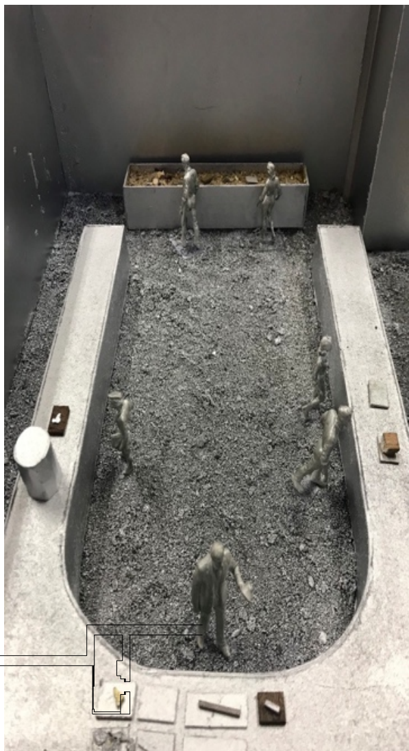
Dimostrazione e processo di fusione con sabbia